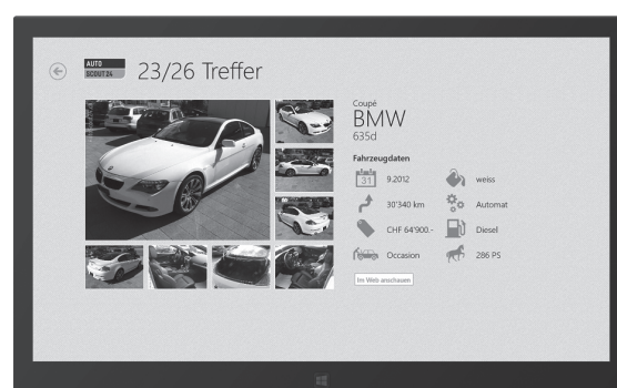
Ansicht der Fahrzeugdaten.