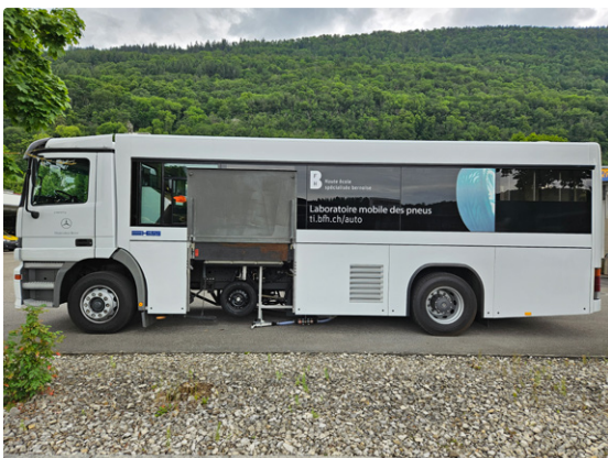
Mobiles Reifen- Labor (MoReLab)